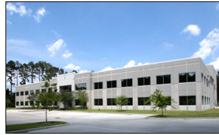
Empresas de procesamiento, almacenamiento y distribución pueden calificar para recibir incentivos si se ubican en la zona empresarial.

Las siguientes empresas/ desarrollos residenciales pueden calificar para ubicarse en el Centro de Desarrollo de Negocios de Columbus: